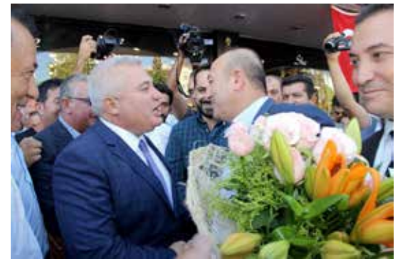
ALTSO Başkanı Mehmet Şahin Bakan Çavuşoğlu'nu oda hizmet binası girişinde karşıladı.