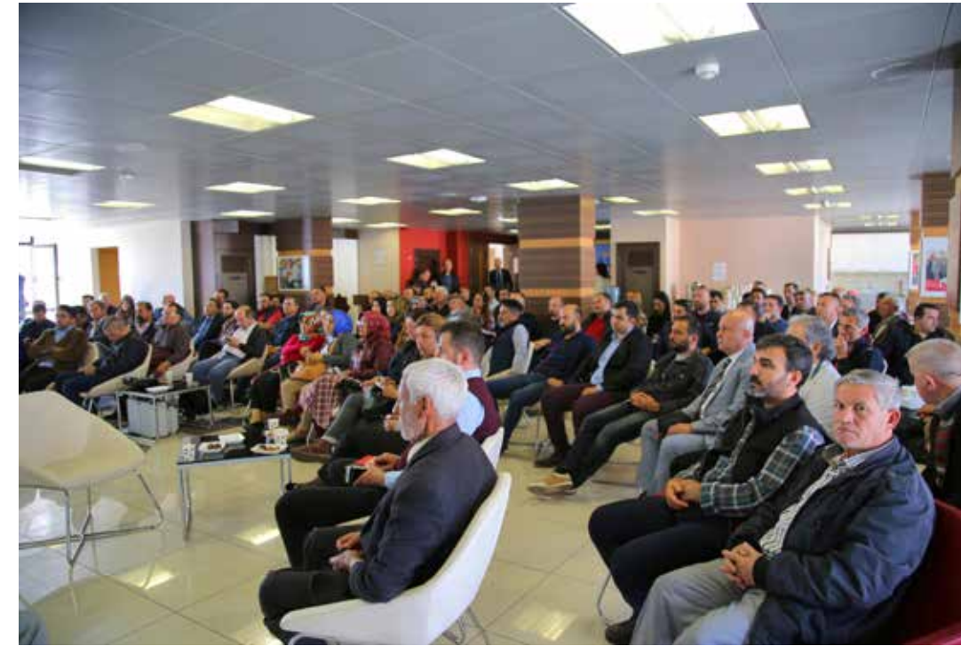
ALTSO Konferans salonunun tıklım tıklım dolması nedeniyle fuaye salonunda kamera sistemi kuruldu. Salona sığmayan kalabalık bu sayede programı canlı takip edebildi.

'Çok şükür ki milletimizin sağduyusu, iş dünyamızın basireti ve yoğun gayretleriyle ülkemiz üzerindeki olumsuzlar bertaraf edilmiştir' diyen Başkan Şahin, "Özellikle 15 Temmuz günü Fetullahçı Terör Örgütü mensuplarınca planlanan alçak darbe girişimi karşısında milletimizin feraseti bir arada olduğumuz zaman neleri başarabileceğimizi de hem içeride hem dışarıdaki dosta, düşmana net biçimde göstermiştir" dedi.