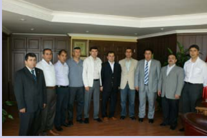
TÜRKLER BELEDİYE BAŞKANI HAYRİ ÇAVUŞOĞLU