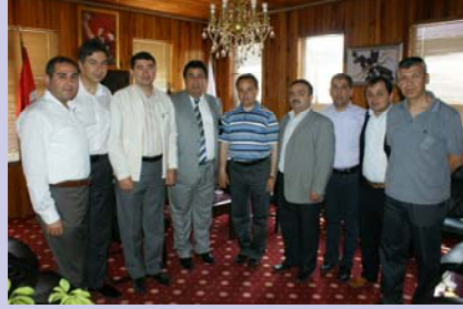
EMİŞBELENİ BELEDİYE BAŞKANI NURETTİN ULUDAĞ