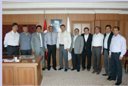
PAYALLAR BELEDİYE BAŞKANI ABDULLAH ÖZTÜRK